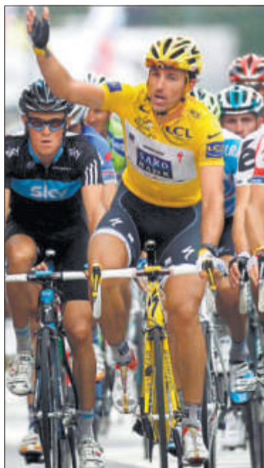
Gibt im Tour-Feld den Ton an: der Schweizer Fabian Cancellara.

97. Tour de France. 4. Etappe, Cambrai - Reims (153,5 km): 1. Petacchi (It) 3:34:55 (42,854 km/h). 2. Dean (Neus). 3. Boasson Hagen (No), gefolgt vom ganzen Feld mit der gleichen Zeit. Gesamtklassement: 1. Cancellara (Sz) 18:28:55. 2. Thomas (Gb) 0:23. 3. Evans (Au) 0:39. 4. Hesjedal (Ka) 0:46. 5. Chavanel (Fr) 1:01. 6. Andy Schleck (Lux) 1:09. 7. Hushovd (No) 1:19. 8. Winkovarov (Russ) 1:31. 9. Contador (Sp) 1:40. 10. Van den Broeck (Be) 1:42. – Ferner: 13. Mentschow (Russ) 1:49. 14. Wiggins (Gb) gleiche Zeit. 18. Armstrong (USA) 2:30. 47. Sastré (Sp) 3:19. 48. Basso (It) 3:20. 54. Elmiger (Sz) 3:26. 125. Rast (Sz) 12:35. 159. Morabito (Sz) 18:58.